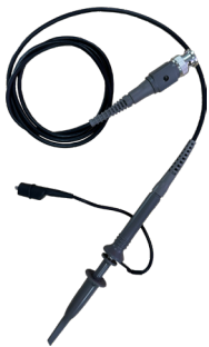
Sonda OSCILLOSCOPIO / GENERATORE DI SEGNALI