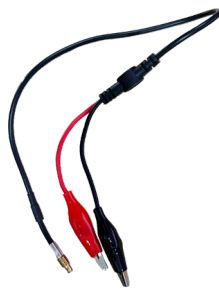
Cavo con clip a coccodrillo OSCILLOSCOPIO / GENERATORE DI SEGNALI