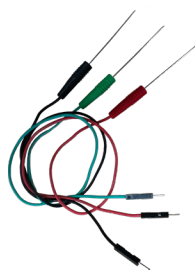
3x sonde di test SMD TESTER DI COMPONENTI